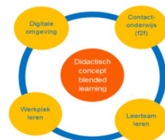
Figuur 1 Didactisch concept

De opleiding heeft voor een didactisch concept gekozen dat wordt vormgegeven vanuit blended learning (zie figuur 1). Dit concept is geïnspireerd op het sociaal constructivisme waarin leren wordt gesitueerd als een sociaal proces in de interactie met de omgeving. De didactiek gaat uit van verschillende vormen van leren en onderwijsstrategieën. In de bijeenkomsten met studenten richt het informatieve leren zich op het aanreiken van kennis, inzichten en theoretische concepten en wordt ondersteund door een digitale omgeving.