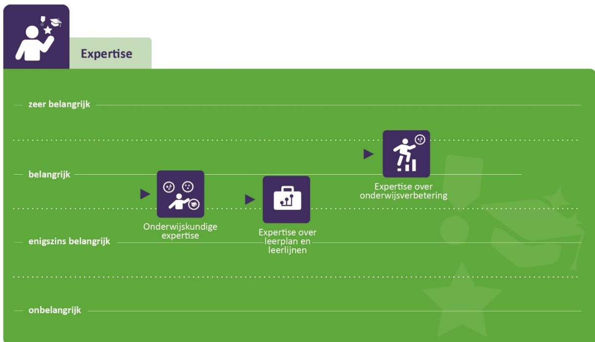
Figuur 1: Gemiddelde scores met betrekking tot de benodigde expertisegebieden van zij-instromende schooldirecteuren

De resultaten laten zien dat de respondenten, relatief gezien, het meest belangrijk vinden dat zij-instromende schooldirecteuren beschikken over expertise met betrekking tot onderwijsverbetering (zie figuur 1).