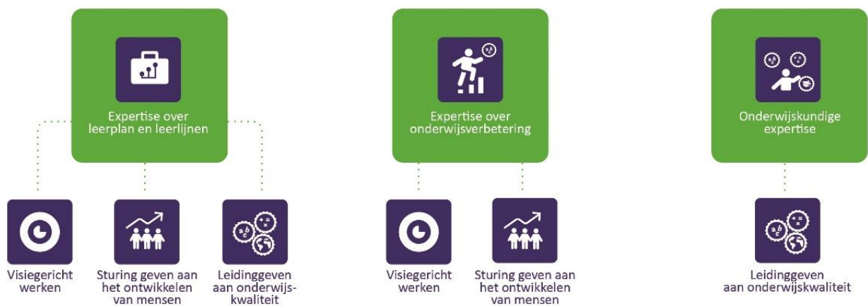
Figuur 3: Belang van benodigde expertisegebieden zij-instromende schooldirecteuren voor leiderschapspraktijken

Met betrekking tot de onderzoeksvraag lieten de resultaten zien dat, in de ogen van respondenten, met name expertise over leerplan en leerlijnen van belang is voor het goed kunnen uitoefenen van drie van de vijf leiderschapspraktijken van de beroepsstandaard schoolleiders po (zie figuur 3).